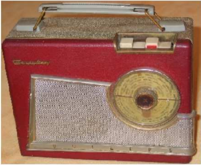
Rouge et tweed gris